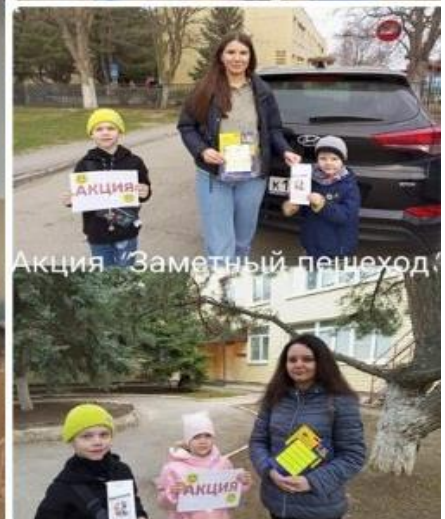
Акция "Заметный пешеход"