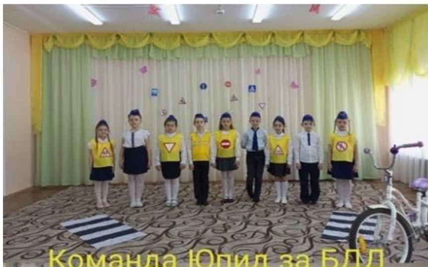
Команда Юпид за БДД